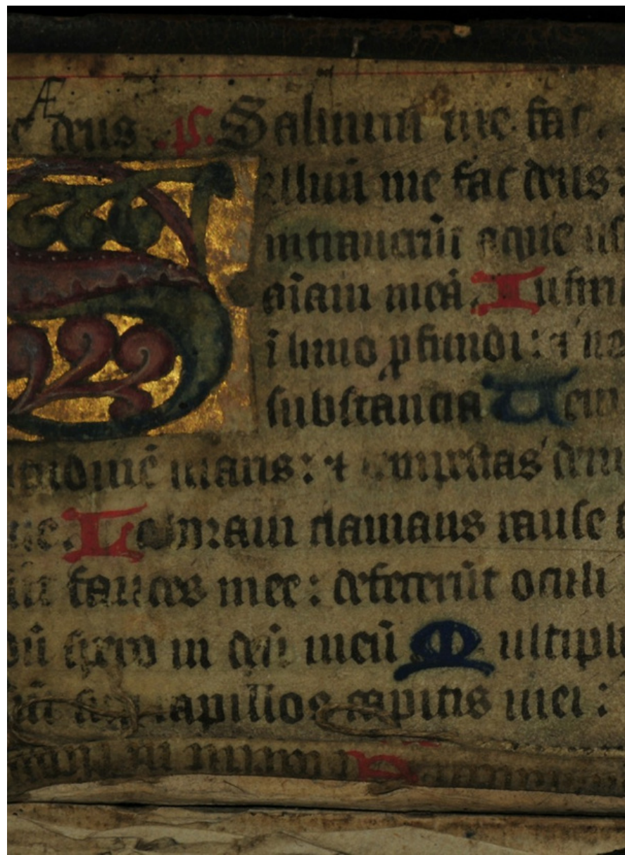
DANS L'ANCIEN TESTAMENT